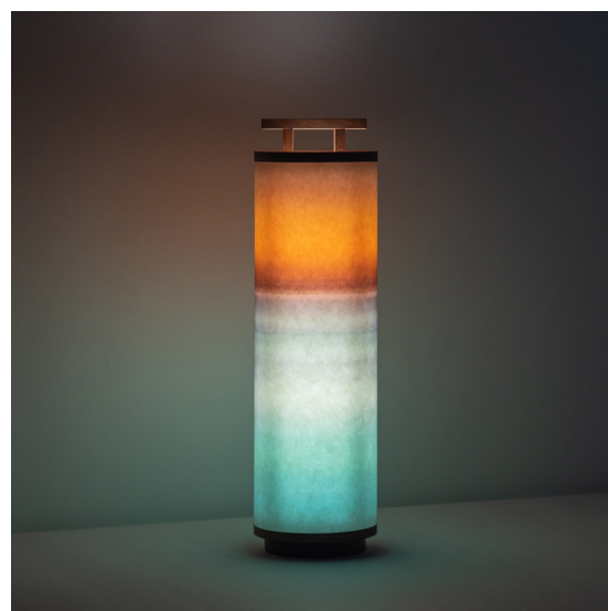
Loup - Vendu