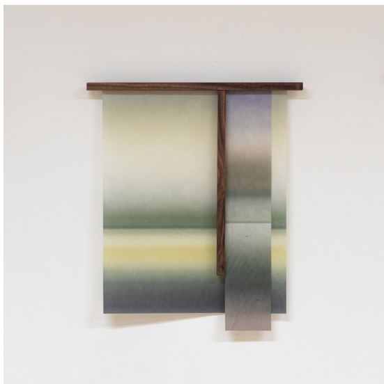
Ecel - 42 x 50 cm