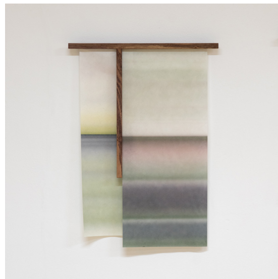
Allv - 42 x 57 cm