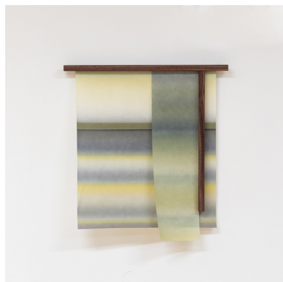
Dvds - 42 x 45 cm - Vendu