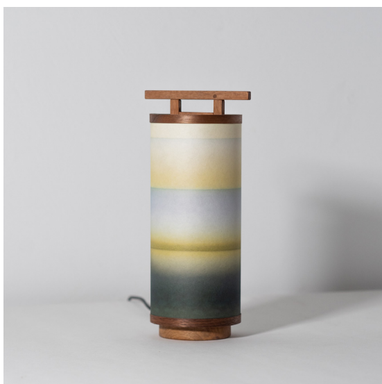
Casti - Vendu