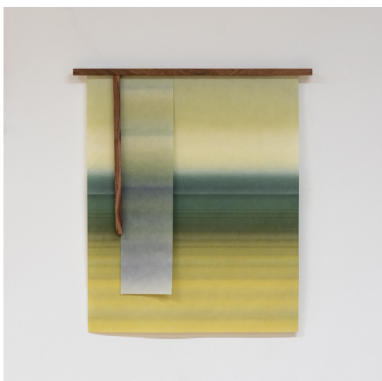
Jlep - 54 x 60 cm - Vendu