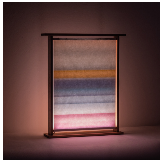
Roch - Vendu