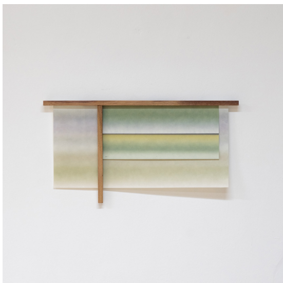
Lrdm - 60 x 30 cm