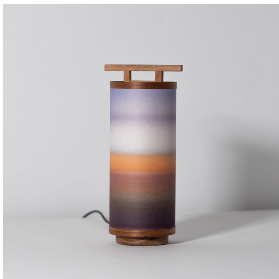
Trav - Vendu