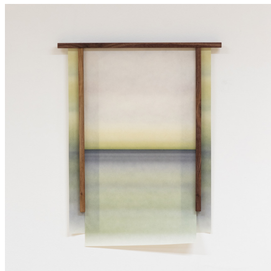
Vslm - 48 x 60 cm