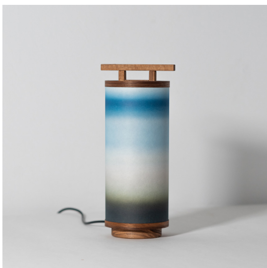
Vern - Vendu